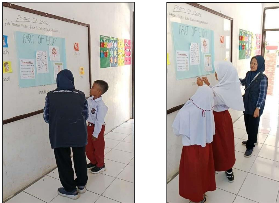
Gambar 3. Games

Setelah itu, penulis melanjutkan menjelaskan materinya lewat games dengan memasang bagian-bagian gambar Part of Body, dan mengisi bagian yang kosong pada beberapa nama-nama Part of Body. Permainan ini berlangsung kurang lebih 10 menit. Permainan yang berkaitan dengan materi berakhir, selanjutnya penulis membagikan soal posttest yang berisi pertanyaan yang sama dengan soal pretets.