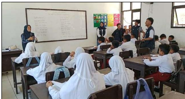
Gambar 1. Tulisan Lirik Lagu Part of Body